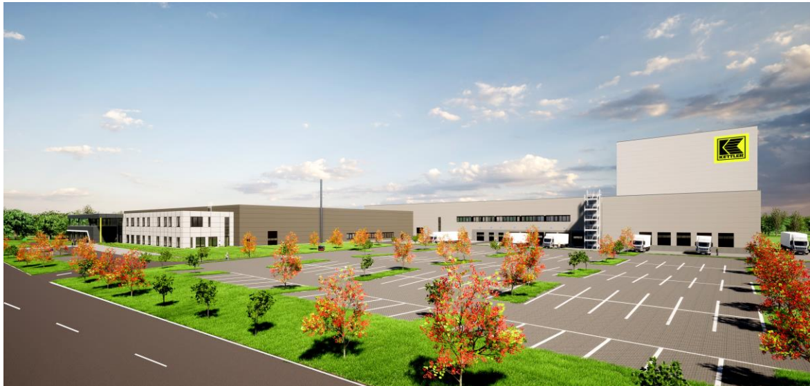
De geplande, nieuwe locatie van KETTLER Alu-Rad GmbH in St. Ingbert (Visualisatie: © LIST Group)

De nieuwe locatie in St. Ingbert, Saarland is ongeveer 25 km verwijderd van de huidige productiesite in Hanweiler en vult deze aan en zal deze dus uitdrukkelijk niet vervangen! De productie wordt reeds opgestart in het eerste kwartaal van 2022 en biedt tewerkstelling aan 300 medewerkers.